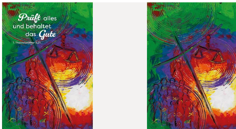
Acryl von Doris Hopf

Betrachtet erst das Bild ohne Text. Was fällt euch dazu ein? Was seht ihr. Was gefällt euch/gefällt euch nicht? Wofür stehen die Motive eurer Meinung nach?